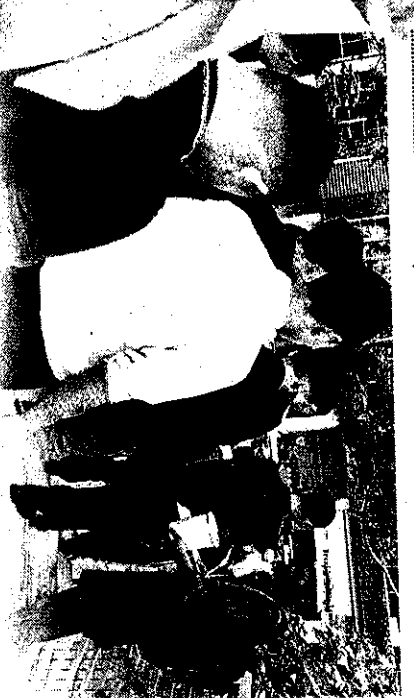
WARGA asing mengutip derma di masjid sekitar Kuantan.

"Meraka ini juga bertindak kurang sopan apabila meletakkan kotak sumbangan di atas tabung milik masjid dengan harapan kutipan meraka dapat dimaksimumkan," katanya.