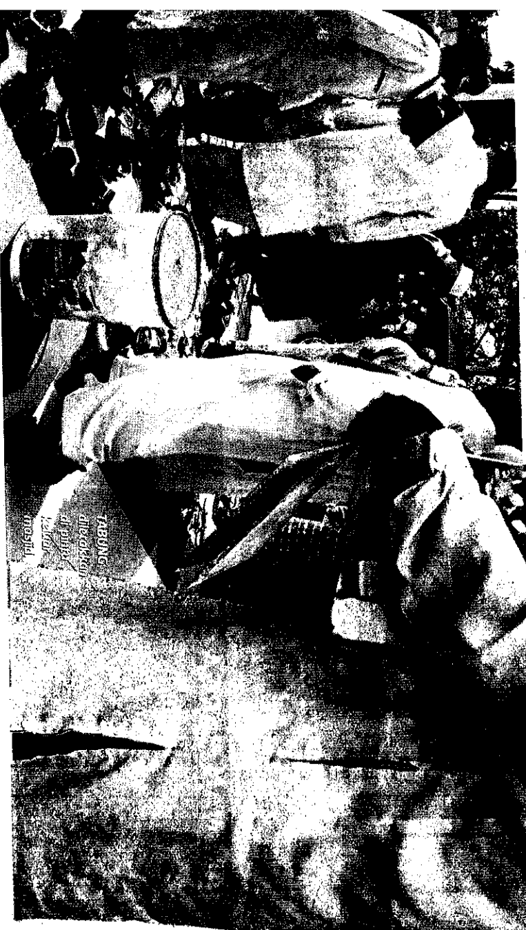
TABUNG diletakkan di pintu masuk masjid.

Katanya, meraka perlu memastikan kumpulan peminta derma ini mempunyai surat kebenaran pihak berkuasa bagi berbuat demikian melalui bersedekah melalui masjid, surau atau peributan bukan kerajaan (NGO) yang berdaftar.